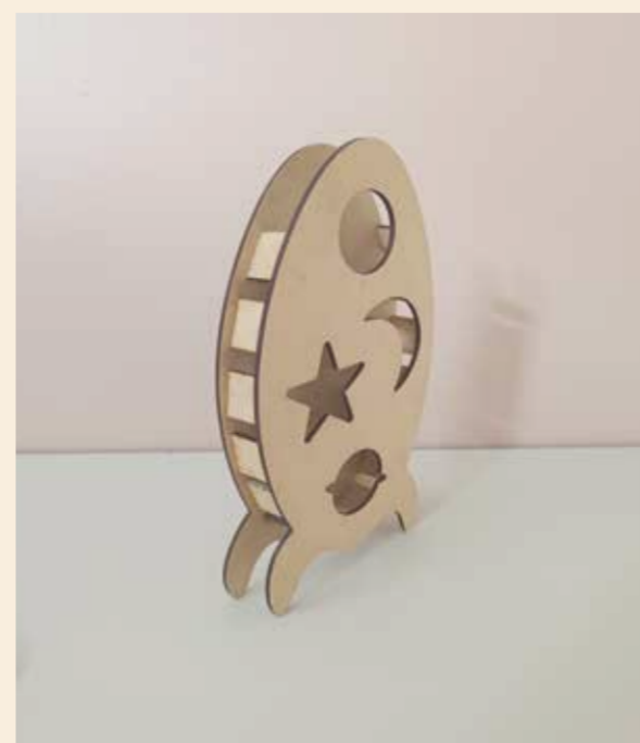
Prototyper plocklåda raket