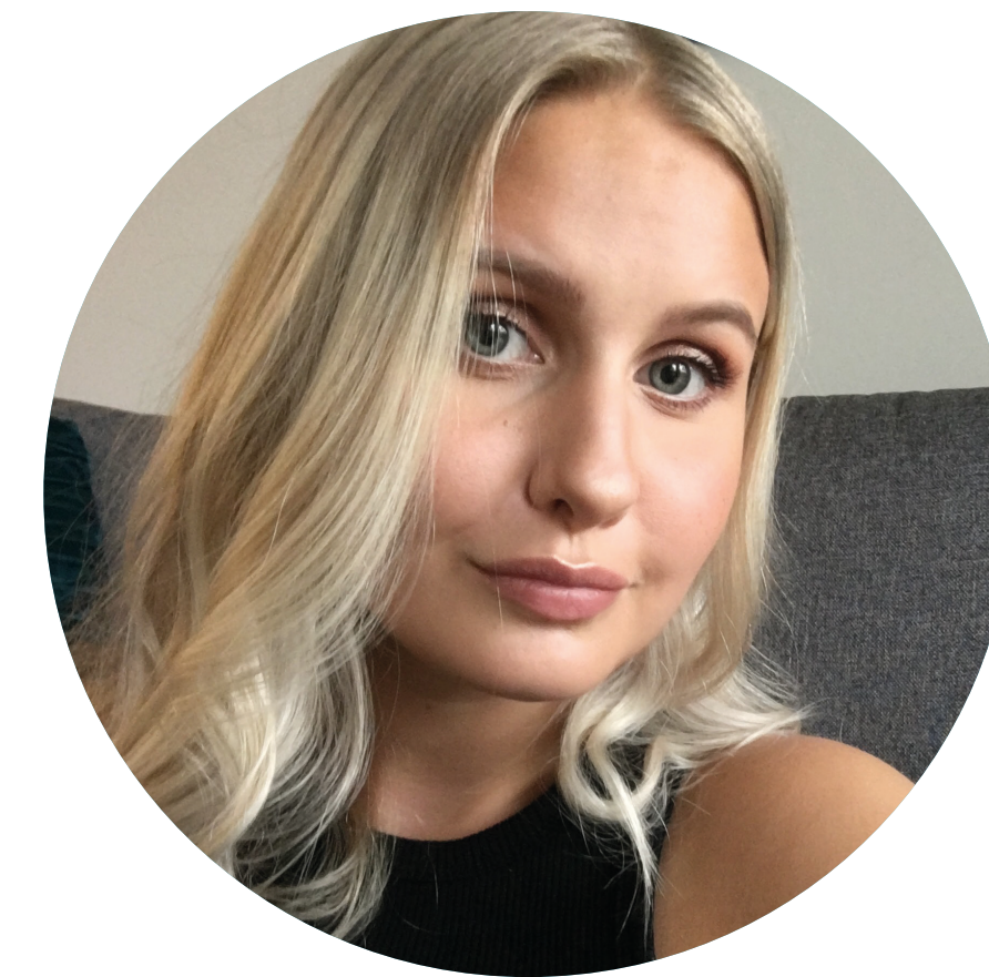
Nellie Porsedal Layout & Grafisk formgivning