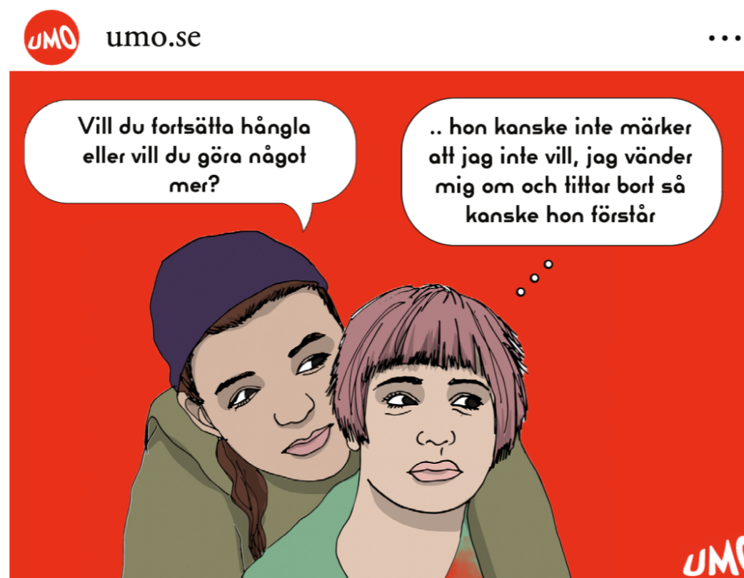
gilla-markeringar umo.se I porren är det nästan aldrig någon som kollar att allt känns okej för de som har sex. I verkliga sexet måste du vara säker på att de du har sex med är okej med allt du gör.