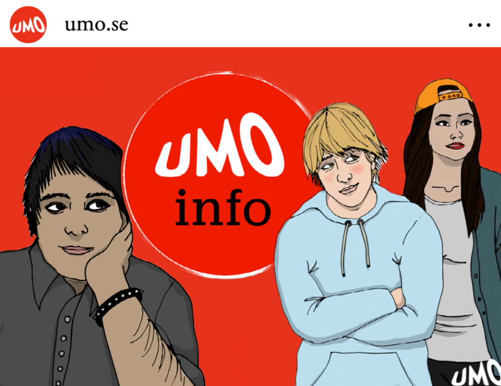
gilla-markeringar umo.se Tittar du på porr och känner att den påverkar dig eller andra i din omgivning? I denna bildserie kommer lite bra information att tänka på kring porren.