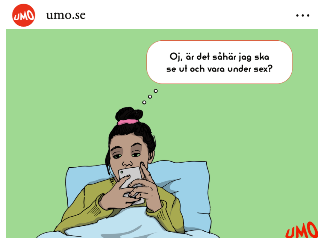
gilla-markeringar umo.se Det är lätt att tro att sex ska vara som i porren, men porr är inte till för att visa hur sex går till eller en verklig bild över hur man ska se ut.